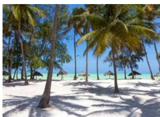
Nungwi 📍 🚗 50km - ⌚ 1h Mangapwani 📍 Paje 📍