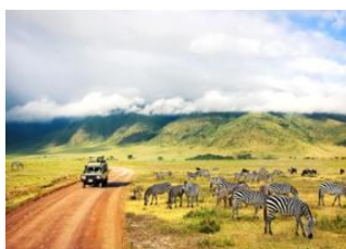
Lac Manyara (parc national)