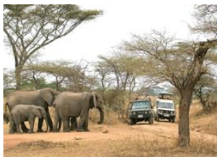
Tarangire National Park