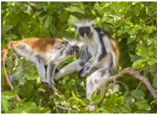
Paje 📍 Stone Town 📍