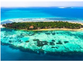
Stone Town 📍 - ⌚ 4h Prison Island 📍