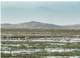
Village Naiyobi 📍 - ⌚ 3h Lake Natron 📍 🚗 - ⌚ 1h Engare Sero 📍