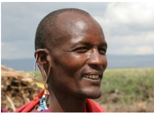
Empakaai Crater 📍 25km - ⌚ 6h Village Naiyobi 📍