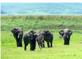
Ngorongoro Conservation Area 📍