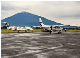
Kilimanjaro Airport 📍 🚗 48km - ⌚ 1h Arusha 📍