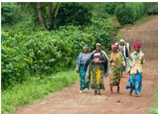
Tarangire National Park 📍 🚗 90km - ⌚ 2h Karatu 📍