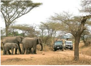
Tarangire National Park 📍