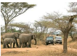
Arusha 📍 🚗 30km - ⌚ 30m Parc National Arusha 📍 🚗 130km - ⌚ 2h Tarangire National Park 📍