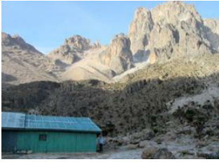
Mount Kenya Naro Moru Park Gate 📍 - ⌚ 8h Shipton Camp (4200 m) 📍