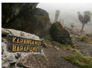
Barranco Hut (3 800 m) 📍