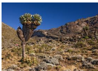
Shira Hut (3 800 m) 📍