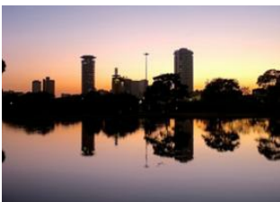
Met Station (3 050 m) 📍