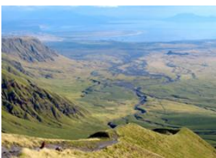
Parc national du Serengeti 📍 🚗 - ⌚ 4h Lac Natron 📍