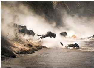
Parc national du Serengeti 📍