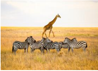
Lac Ndutu 📍 🚗 - ⌚ 1h Parc national du Serengeti 📍