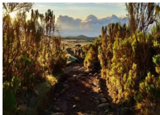
Kibo Hut (4 705 m). 9 Uhuru Peak (5 895 m) 9 Horombo Hut (3.800 m) 9