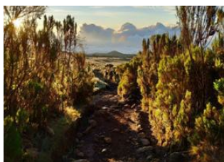
Marangu 📍 - ⌚ 6h Mandara Hut 📍 Mandara Hut (2700 m) 📍