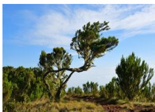
Horombo Hut (3.800 m) 9 - ⌚ 6h Marangu 9