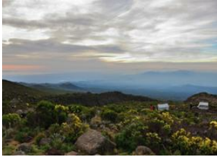
Mandara Hut 📍