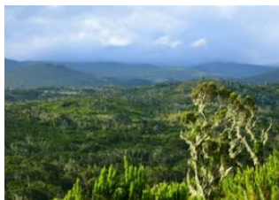
Kilimanjaro Airport 📍 🚗 80km - ⌚ 2h Marangu 📍