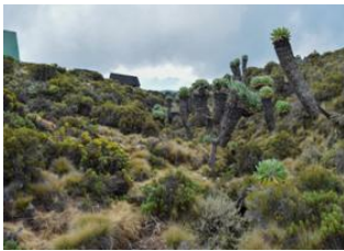
Horombo Hut 📍