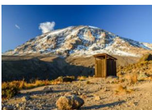
Horombo Hut 📍