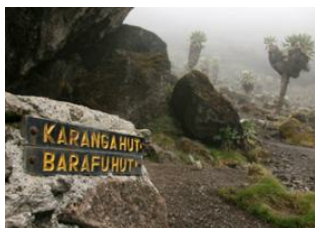
Barranco Hut (3 800 m) ▼ - ☉ 7h Barafu Hut (4 600 m) ▼